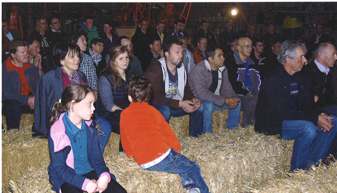
Die erste Strohballenarena war mit 120 Interessierten sehr gut besucht. (tos)