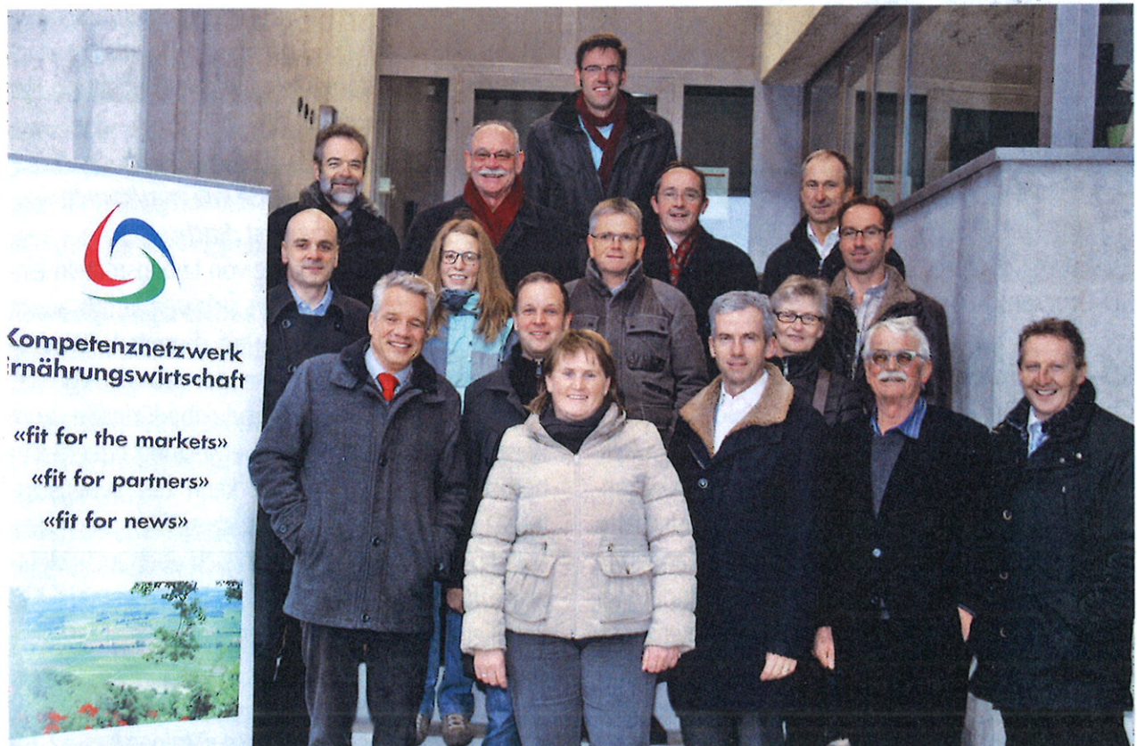
Die Gäste des ersten Supportertreffens des Kompetenznetzwerkes Ernährungswirtschaft finden sich zum Gruppenfoto auf dem Areal der Meyerhans Mühlen AG ein.